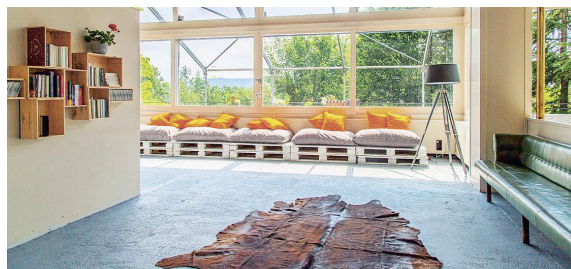
Zwischennutzung Dolder Waldhaus