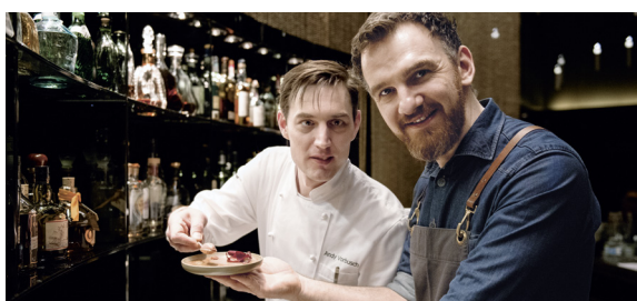
The After Dinner Experience