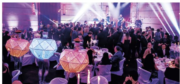
New Year's Eve