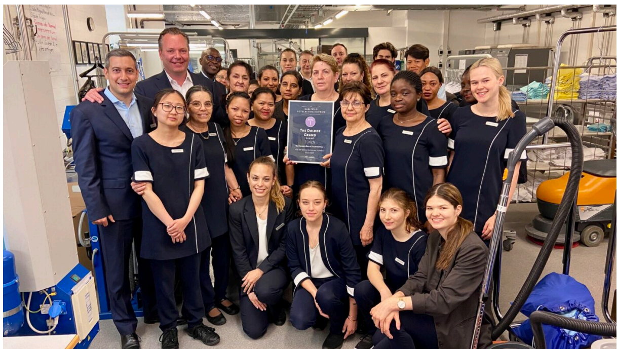
Die SonntagsZeitung kürt das Dolder Grand zum besten Stadthotel der Schweiz

Die Stiftung myclimate würdigte mit dem Award unsere umfassende, langjährige Nachhaltigkeitsstrategie und die vielen schon ergriffenen Massnahmen des Dolder Grand. Im Oktober erhielten wir erneut die «EarthCheck Silver»-Zertifizierung.