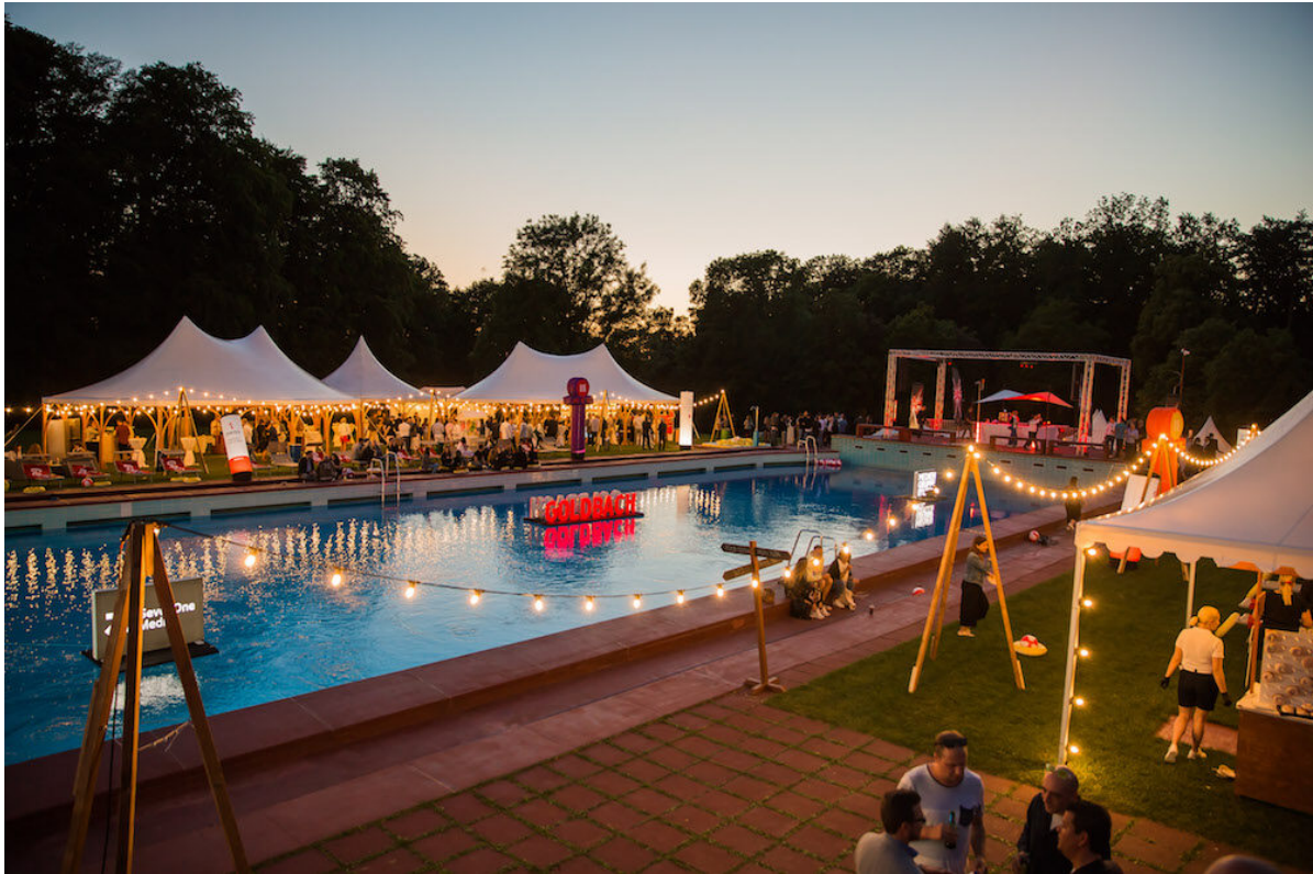
Sommerfest von Goldbach

Die ZKB führte am 25. Juni 2022 einen grossen Corporate Event im Dolder Bad mit rund 3'000 geladenen Gästen durch. Goldbach feierte am 6. und 7. Juli 2022 sein Sommerfest mit über 1'100 Mitarbeitenden ebenfalls exklusiv im Dolder Bad.