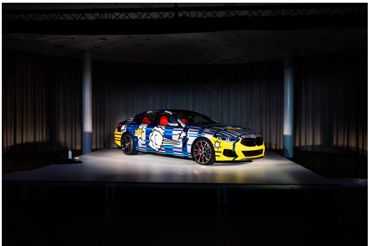
BMW-Autovorstellung des «The 8 Jeff Koons»

Im April zählten wir insgesamt über 2'500 Personen bei den Veranstaltungen «Matter of Taste», «A Night at the Grand» und bei der BMW-Autovorstellung des «The 8 Jeff Koons».