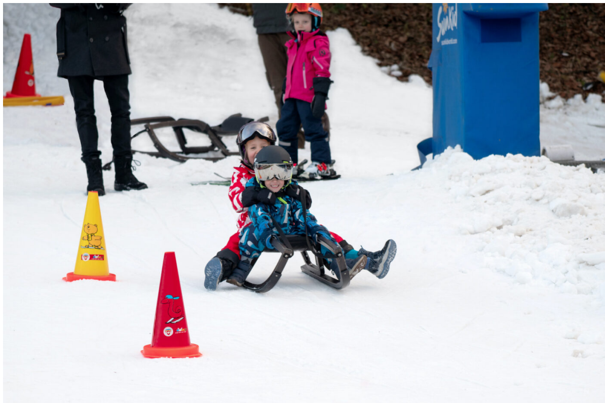
Unterwegs auf der erstmals entworfenen Piste

Vom 3. bis zum 28. Januar 2022 nutzten hauptsächlich Schulklassen die für die Wintersaison 2021/22 erstmals entworfene Skipiste. Die Betreuung erfolgte durch die Ski- und Snowboardschule Zürich.