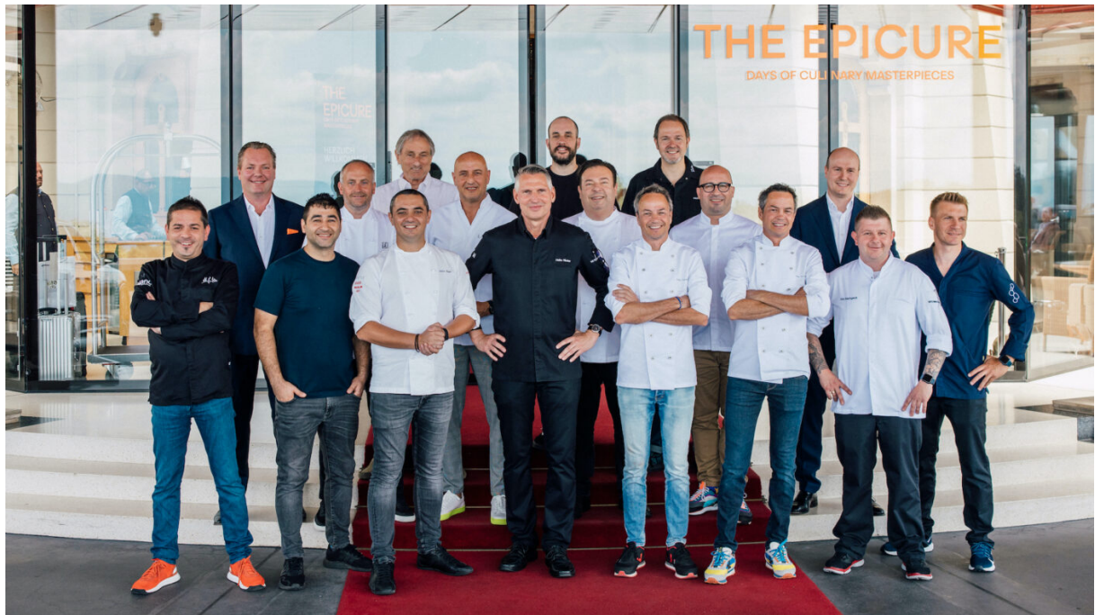
Gourmetfestival THE EPICURE

Seit August bietet das Dolder Grand im Room-Service Pizza an. Zum ZFF und als Hommage an den Hollywood-Film «The Girl with the Dragon Tattoo», welcher teils im Dolder Grand gedreht wurde, kredenzt die Canvas Bar & Lounge den «Pink Dragon»-Cocktail.