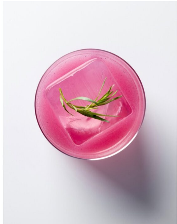
«Pink Dragon»-Cocktail als Hommage an den Hollywood-Film «The Girl with the Dragon Tattoo»