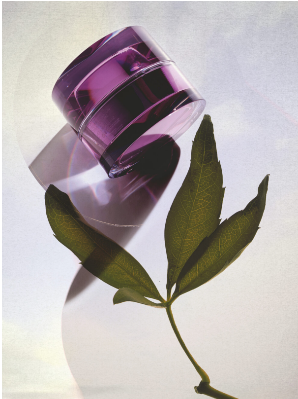
Starfotograf Peter Langer setzt die Spa-Produkte neu in Szene