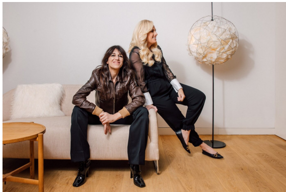
Charlotte Gainsbourg und Rebel Wilson

Mit CHF 6,5 Mio. und einer Auslastung von 75 % zählte der September zu einem der umsatzstärksten Monate in der Firmengeschichte. Die Partnerschaft mit dem Zurich Film Festival (ZFF), die Beherbergung teilnehmender prominenter Gäste wie Rebel Wilson und Charlotte Gainsbourg sowie die Afterpartys wurden nicht nur von der Öffentlichkeit und von der Presse positiv wahrgenommen, sondern trugen auch zum gesamtheitlichen Erfolg im September bei.