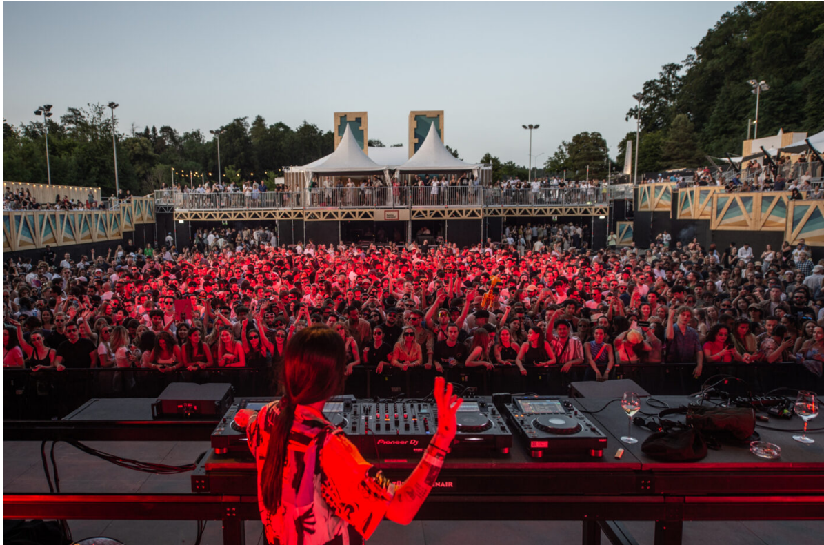
«ZOA City» mit der südkoreanischen Musikproduzentin und DJane Peggy Gou

Im sechsten Monat des Jahres gab es erstmals nach sieben Jahren wieder eine «ZOA City»-Konzertreihe auf dem Areal der Dolder Kunsteisbahn. Vor der Eröffnung hielt die Zürcher Kantonalbank ihr Sommerfest mit über 4'300 Teilnehmerinnen und Teilnehmern ab. Am Eröffnungsereignis des «ZOA City» am 17. Juni 2022 legte die bekannte südkoreanische Musikproduzentin und DJane Peggy Gou auf. Vom 12. bis zum 31. Juli 2022 zählte die Konzertserie mit Stars wie Amy Macdonald über 15'000 Besucherinnen und Besucher.