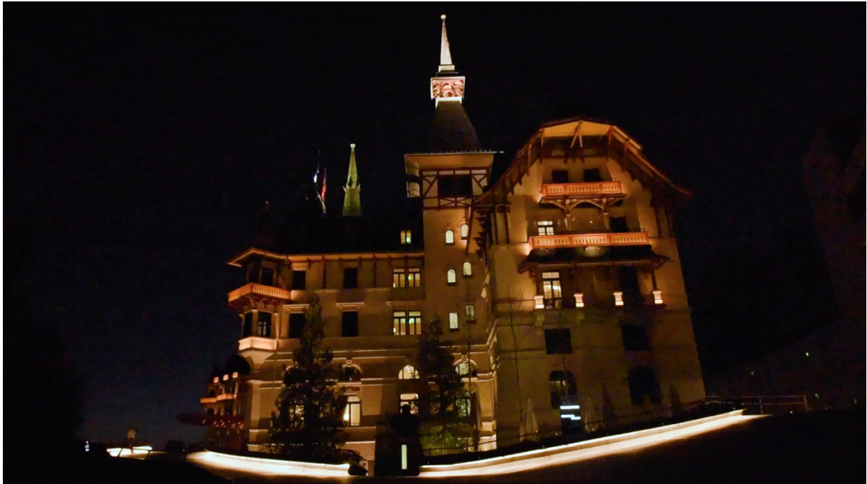
Die globale Earth Hour am 26. März 2022

Zur traditionellen «Waldputzete» am 22. April hat ein Team von Helfern den Wald rund um das Hotel von Müll befreit.